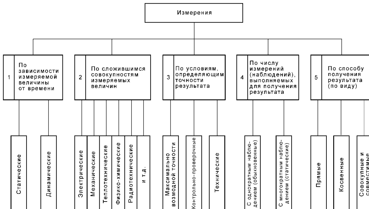
Рисунок 1 – Классификация средств измерения