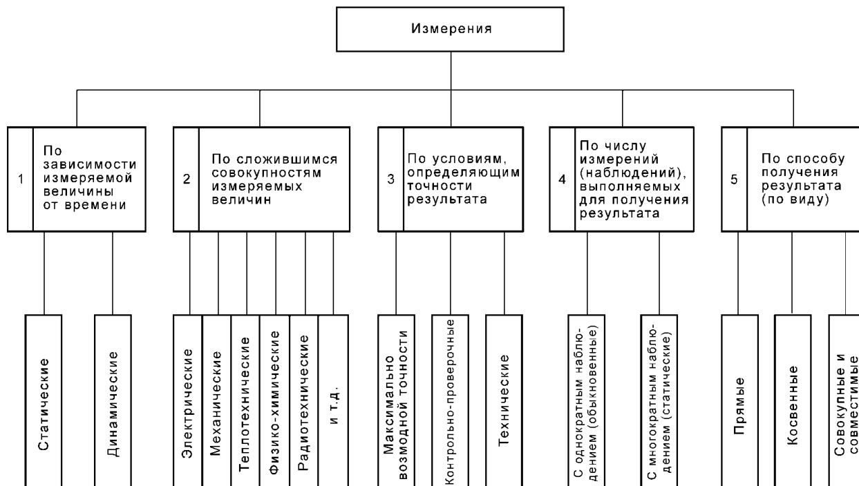
Рисунок 1 – Классификация средств измерения