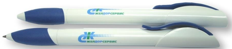
Рис 4. Пример дизайна ручки

Тема 7. Плоская печать и ее виды. Особенности подготовки макета.