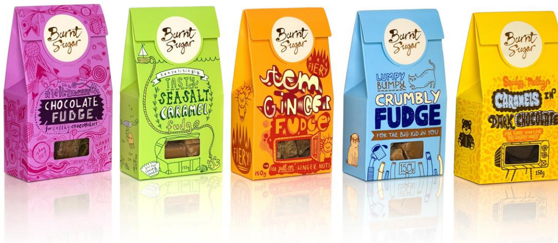
Рис2. Пример дизайна упаковки печенья

Тема 6. Глубокая печать и ее виды. Особенности подготовки макета.