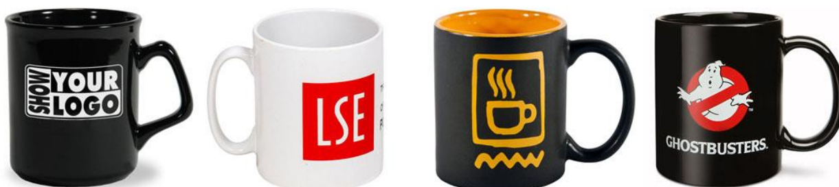
Рис 3. Пример дизайна кружки