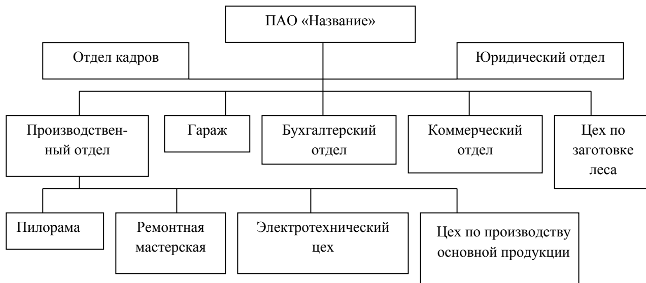
Рисунок 1 – Организационная структура ПАО «Название»

- состав линейных и функциональных звеньев ПАО, количество уровней управления организацией; наличие горизонтальных и вертикальных связей в организационной структуре предприятия.