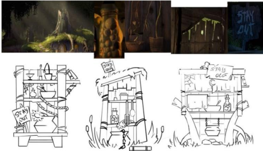
Рис. 1 Рисование шкафа в анфас