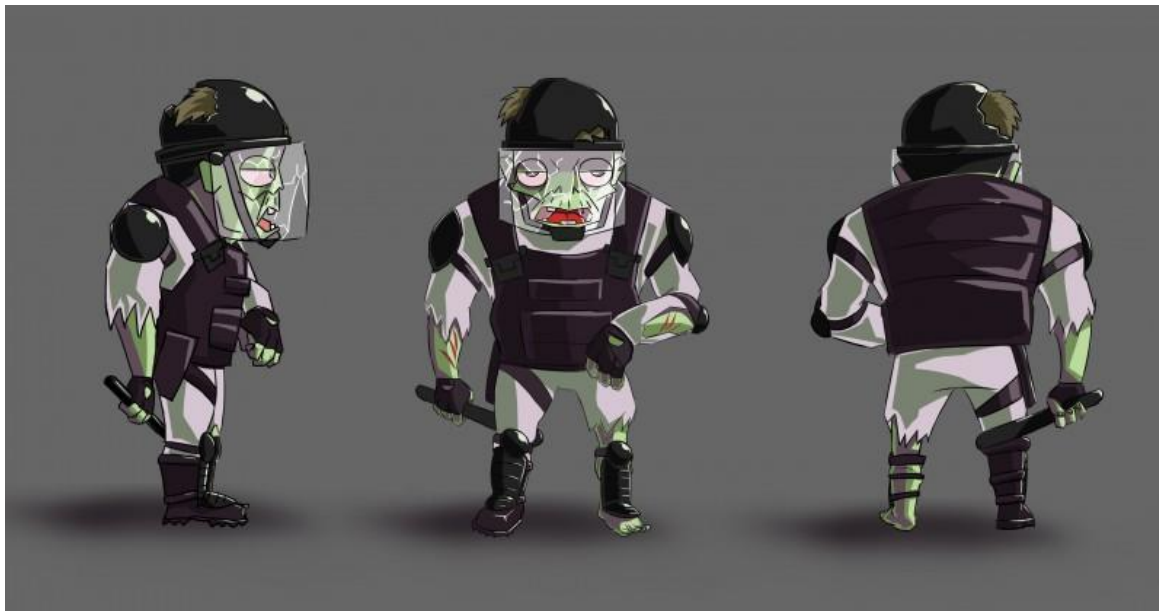
Рис. 4 Пример готового персонажа

Выполнять графическую часть работы рекомендуется в программе Adobe Photoshop на холсте размером 1920x1080 px. Для работы делаются как минимум 3 скетча будущего персонажа.