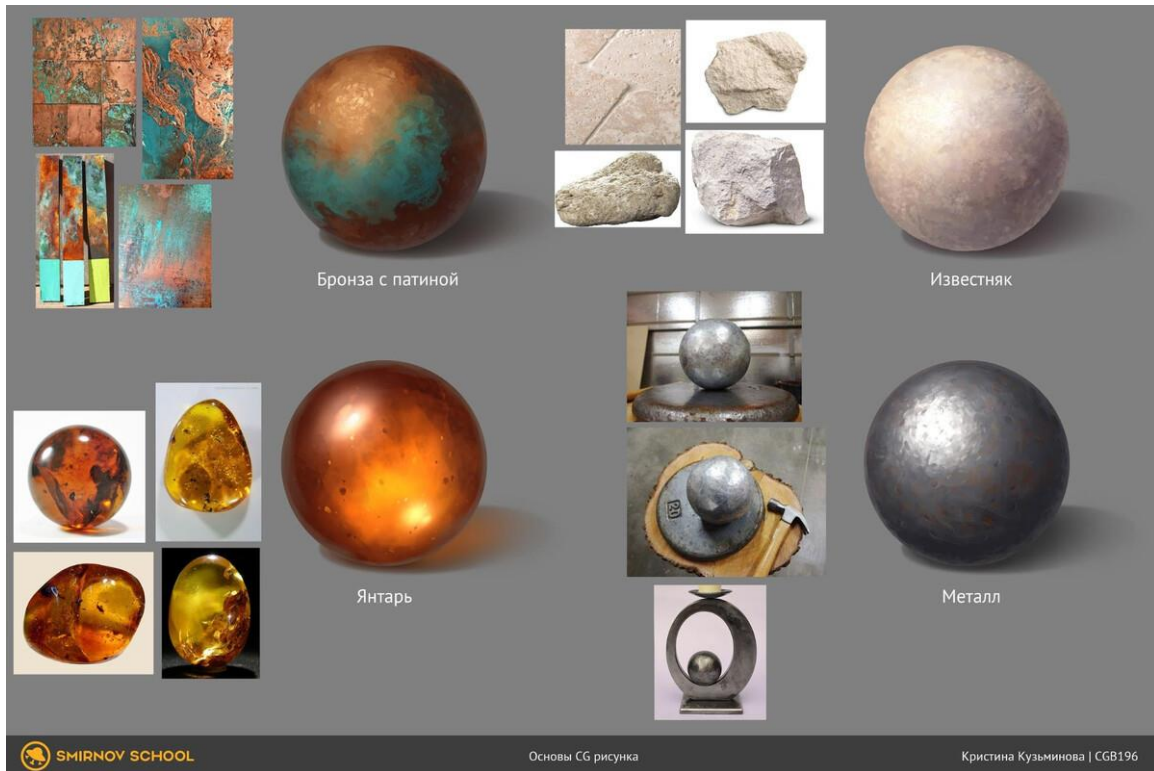
Рис. 2 Пример подборки материалов для проекта

упустить важные нюансы. Есть и другая сторона — использование слишком большого количества референсов для одной учебной работы. В таком случае легко запутаться, и студент тратит очень много времени на создание одного рисунка, что неэффективно.