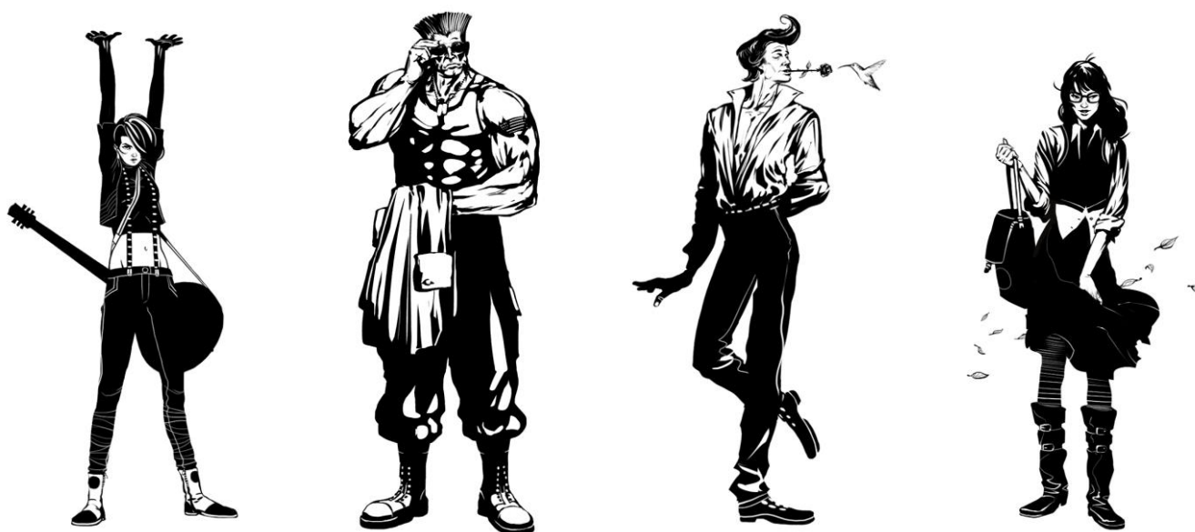
Рис.4 Внешние характеристика персонажей комиксов

3. Всегда интересно не просто смотреть на понравившихся героев, а анализировать их и выделять характерные черты. В комиксах принято наделять главных персонажей четко читаемыми внешними характеристиками, например, злодей, хитрец, романтик и т.д. Обычно если персонаж умный — ему делают увеличенную голову, и большие очки, если он «качок» — у него будут широкие плечи и маленькая голова, у романтических девочек — большие глаза и длинные ресницы и т.д. Все эти характерные детали помогают однозначно считывать образ персонажа. Нужно помнить о соотношении частей тела, т.к. пропорции создают характер персонажа. Например, у большого и драчливого героя будет маленькая голова, широкая грудная клетка, плечи и ноги, рот и подбородок будут выдаваться вперед. Милые персонажи будут иметь пропорции младенца: большая голова, овальное тело, высокий лоб, и маленькие зоны подбородка, рта, глаз. Зная эти особенности, можно добиваться определенных визуальных эффектов.