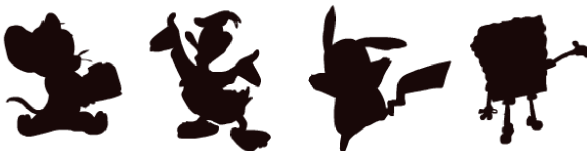
Рис.2 Силуэты персонажей

1. Главное в персонаже — это его узнаваемость и читаемость. Соответственно без четкого силуэта добиться этого сложно. Поэтому первым делом стоит залить персонажа черным и проверить, как он выглядит в качестве пятна. Вот, например, несколько силуэтов — конечно, их можно сразу узнать