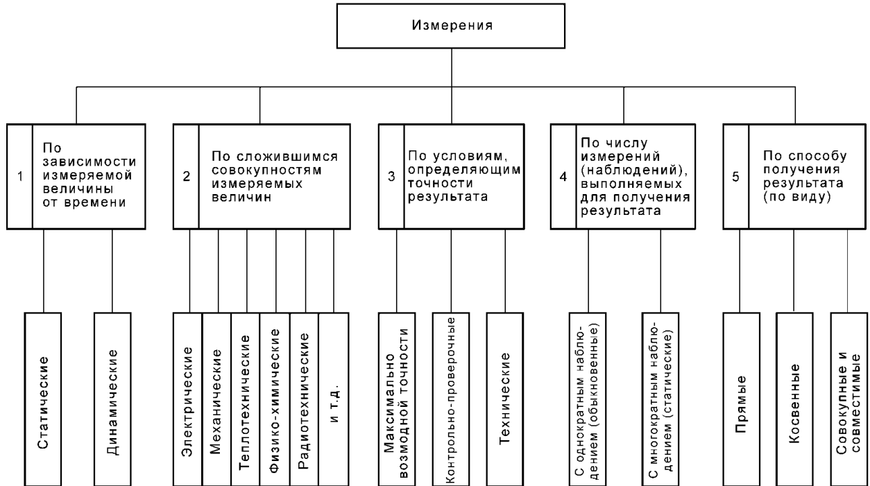
Рисунок 1 – Классификация средств измерения