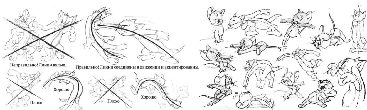
Рис.7 Линии движений персонажей