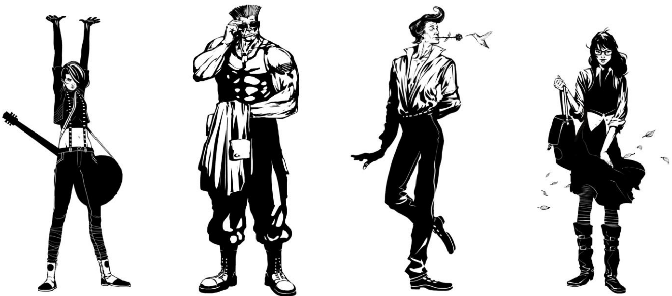
Рис.4 Внешние характеристика персонажей комиксов

3. Всегда интересно не просто смотреть на понравившихся героев, а анализировать их и выделять характерные черты. В комиксах принято наделять главных персонажей четко читаемыми внешними характеристиками, например, злодей, хитрец, романтик и т.д. Обычно если персонаж умный — ему делают увеличенную голову, и большие очки, если он «качок» — у него будут широкие плечи и маленькая голова, у романтических девочек — большие глаза и длинные ресницы и т.д. Все эти характерные детали помогают однозначно считывать образ персонажа. Нужно помнить о соотношении частей тела, т.к. пропорции создают характер персонажа. Например, у большого и драчливого героя будет маленькая голова, широкая грудная клетка, плечи и ноги, рот и подбородок будут выдаваться вперед. Милые персонажи будут иметь пропорции младенца: большая голова, овальное тело, высокий лоб, и маленькие зоны подбородка, рта, глаз. Зная эти особенности, можно добиваться определенных визуальных эффектов.