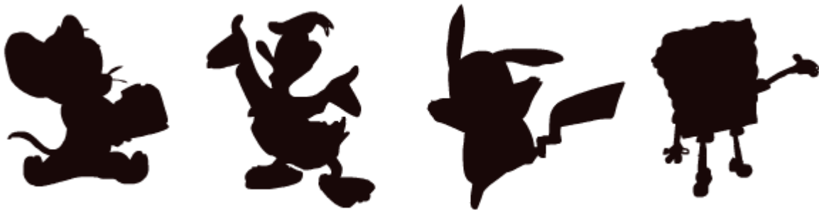
Рис.2 Силуэты персонажей

1. Главное в персонаже — это его узнаваемость и читаемость. Соответственно без четкого силуэта добиться этого сложно. Поэтому первым делом стоит залить персонажа черным и проверить, как он выглядит в качестве пятна. Вот, например, несколько силуэтов — конечно, их можно сразу узнать