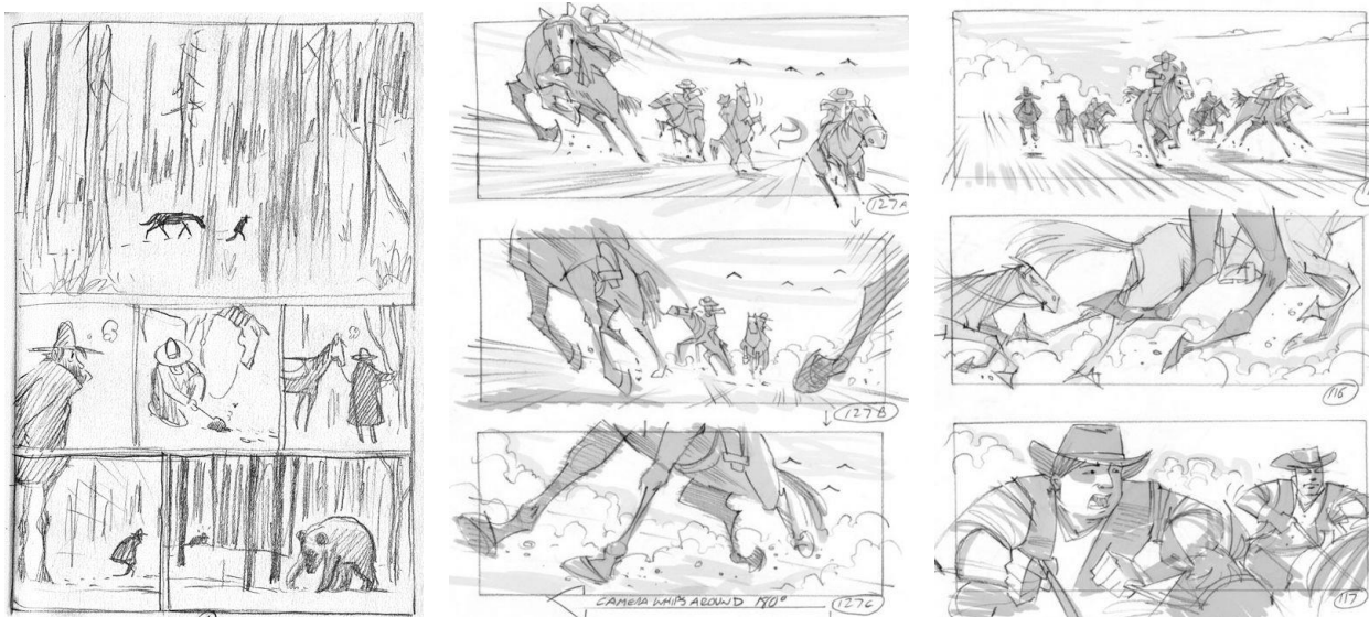
Рис.5 Раскадровки для комиксов