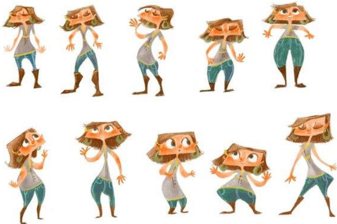
Рис.3 Концепты в работе над персонажами комиксов

2. Не стоит сразу рисовать персонажа и концентрироваться только на одном образе — лучше нарисовать несколько разных концептов и выбрать наиболее удачный вариант. В любом случае с отвергнутых рисунков можно взять интересные детали.