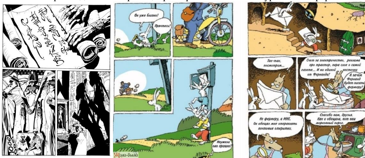
Рис.1. Примеры аналогов графических решений для комиксов