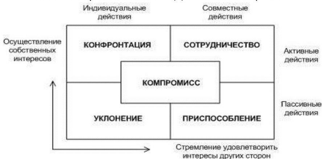
Схема стратегий поведения в конфликте

3. Изучите основные стратегии поведения в конфликте. Подробно изучите представленную схему, подготовьтесь в устной форме объяснить ее содержание.